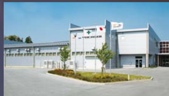
Φωτογραφία: YOCASOL Κεντρικά γραφεία και εργοστάσιο